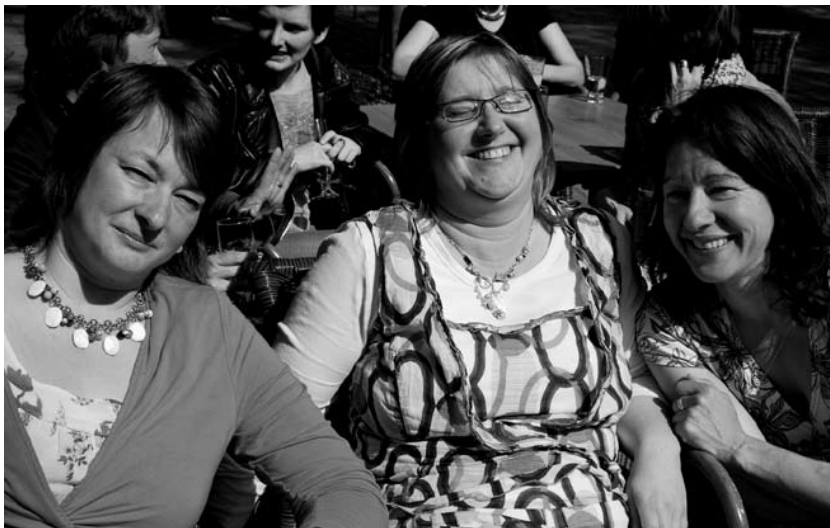
Ook voor deze redactieleden een fijne dag...

onderzoek te doen naar autisme bijvoorbeeld of naar de verwerking van verkrachting in oorlogssituaties.